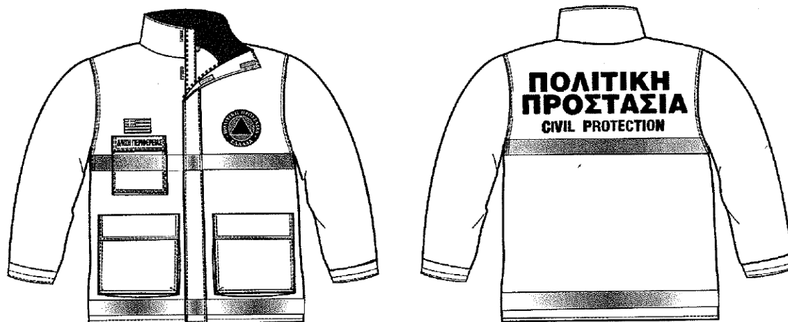
Εικόνα 1. Επιχειρησιακά μπουφάν Πολιτικής Προστασίας

Σύμφωνα με το 4678/22-11-2004 έγγραφο ΓΓΠΠ, τα επιχειρησιακά μπουφάν Πολιτικής Προστασίας θα πρέπει να έχουν την ακόλουθη μορφή: