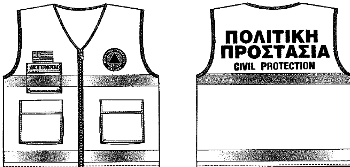
Εικόνα 2. Επιχειρησιακά γιλέκα Πολιτικής Προστασίας

Αναλυτικές προδιαγραφές για την εμφάνιση των επιχειρησιακών μπουφάν και γιλέκων Πολιτικής Προστασίας δίνονται στο 4678/22-11-2004 έγγραφο ΓΓΠΠ.