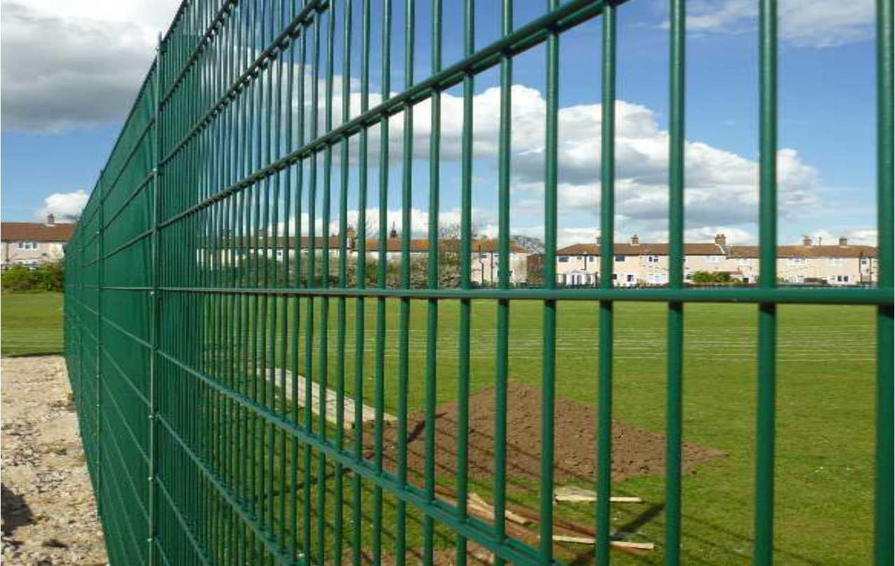
Εικόνα 8: Περίφραξη κατηγορίας 1 τύπου 2 BS 1722-14