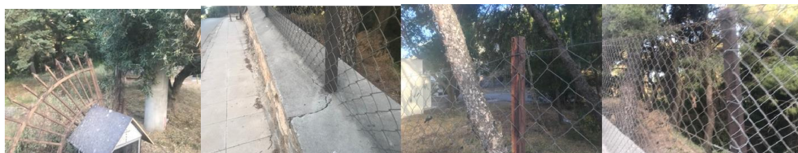
Εικόνες 1-7 : Υφιστάμενη κατάσταση των κατασκευαστικών στοιχείων και της αγκύρωσης.

πακτωθεί οι εκ σιδερογωνιών 30χλστ. Χ 40χλστ. περίπου ορθοστάτες και συρματοπλέγμα 55Χ55 πάχους περίπου 1,5 χλστ. αμφότερα τα κατασκευαστικά στοιχεία παρουσιάζουν φθορές και έντονη οξείδωση και παρά τις επανειλημμένες τοπικές αποκαταστάσεις κρίνονται πλέον ακατάλληλα.