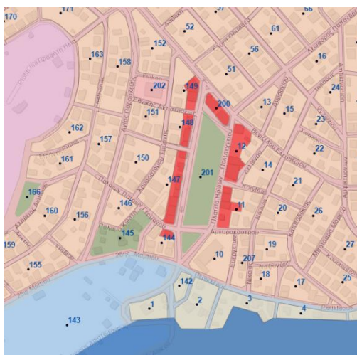
Εικόνα 2: Χρήσεις Γης (ΦΕΚ 700/Δ/1989)

Σύμφωνα με το ΦΕΚ 700/Δ/89, η περιοχή πέριξ της πλατείας ορίζεται ως Κέντρο Γειτονιάς. Ειδικότερα το Κέντρο γειτονιάς χωροθετείται στα μέτωπα των Ο.Τ. και μόνο στα οικοπέδα που έχουν πρόσωπο στην πλατεία.